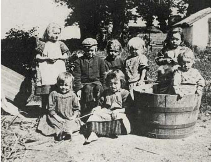
En gruppe børn fra teglværksboligerne ved Nivaagaard Teglværk

En typisk arbejderbolig bestod af to eller tre rum afhængigt af familiens størrelse. Hvis man tager udgangspunkt i en arbejderbolig som den så ud i 1930, ville den ikke ligne noget, vi kender i dag. Eksempelvis havde man ikke et regulært køkken, men blot et bord med en primus. Der var heller ikke indlagt elektricitet, og vand skulle hentes ved vandpumpen udenfor. Tøjtøjsvask foregik enten i et kar på gulvet eller i et vaskehus med gruekedel. Toiletet eller dasset befandt sig ligeledes udenfor. Affald blev kastet ned i et hul eller en rende gravet bagerst i haven. Dette kunne i værste tilfælde tiltrække rotter. Et familiemedlem til en tidligere teglværksarbejder ved Nivaagaard Teglværk beretter, at når man om natten skulle ud og bruge dasset, skulle man første banke på døren for at forskrække rotterne, så de løb væk!